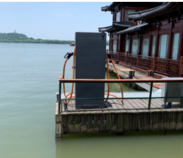
Marin snabbbladdare i Hangzhou, Kina.

Även om det är uppenbart att båtar kommer att elektrifieras precis som bilar är det svårt att prognosticera utvecklingen de kommande fem åren. Infrastrukturen kring båtar och båtförsäljning är annorlunda än motsvarigheten för bilar. Båtar har längre livslängd, varför skillnaden mellan befintlig flotta och årsförsäljning är större än för bilar. Begagnatmarknadens storlek är betydande. Båtproduktionen är också uppdelad mellan motortillverkare och båttillverkare. Få tillverkare producerar både båt och motor. Det betyder att en köpare av en ny båt kan välja mellan motorer av olika typer och olika märken.