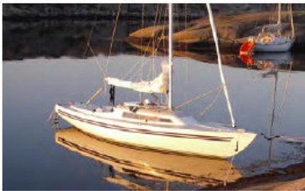
H-Båt. Motor GS10. Batteri: Bly, 24V, 100 Ah