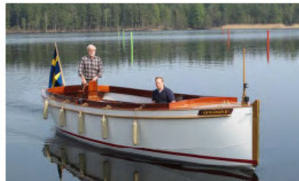
Säfvelången II. Motor GS18. Batteri: Bly, 48V, 200 Ah