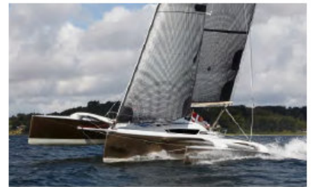
Dragonfly 32. Motor GS18. Batteri: Li, 24V, 320 Ah