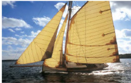
Albatross. Motor GS10. Batteri: Li, 24V, 160 Ah