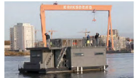
Ocean Living. Motor 2x GS18. Batteri: Bly, 48V, 800 Ah