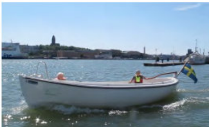
Vikensnipa Motor GS10. Batteri: Li, 24V, 200 Ah